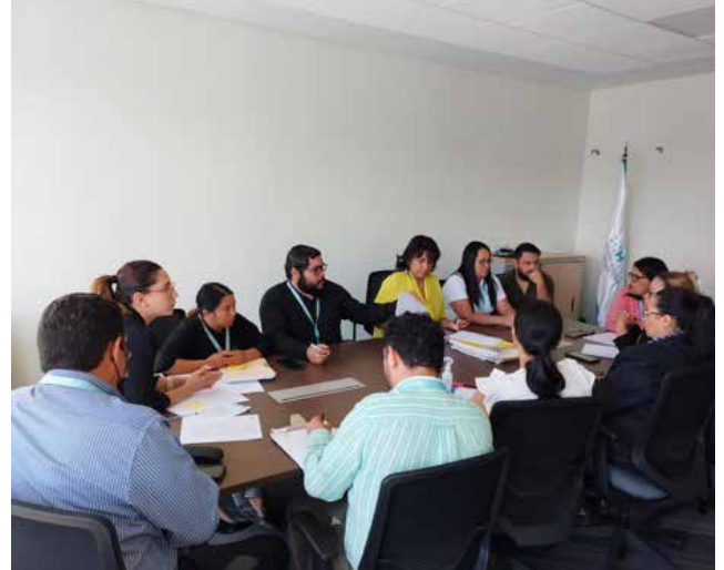
Asimismo, el COCOIN participó en diferentes capacitaciones orientadas al Control Interno y sobre temas de transparencia y lucha contra la corrupción.

La ejecución del Plan Anual de Trabajo del Comité de Control se realizó identificando actividades, plazos de ejecución, responsables de las actividades, productos o resultados esperados, entre otros, considerando todo lo relacionado a las funciones del COCOIN y las responsabilidades asignadas en las Políticas de Control Interno y otros instrumentos emitidos por el Tribunal Superior de Cuentas (TSC) y la Oficina de Desarrollo Integral de Control Interno (ONADICI).